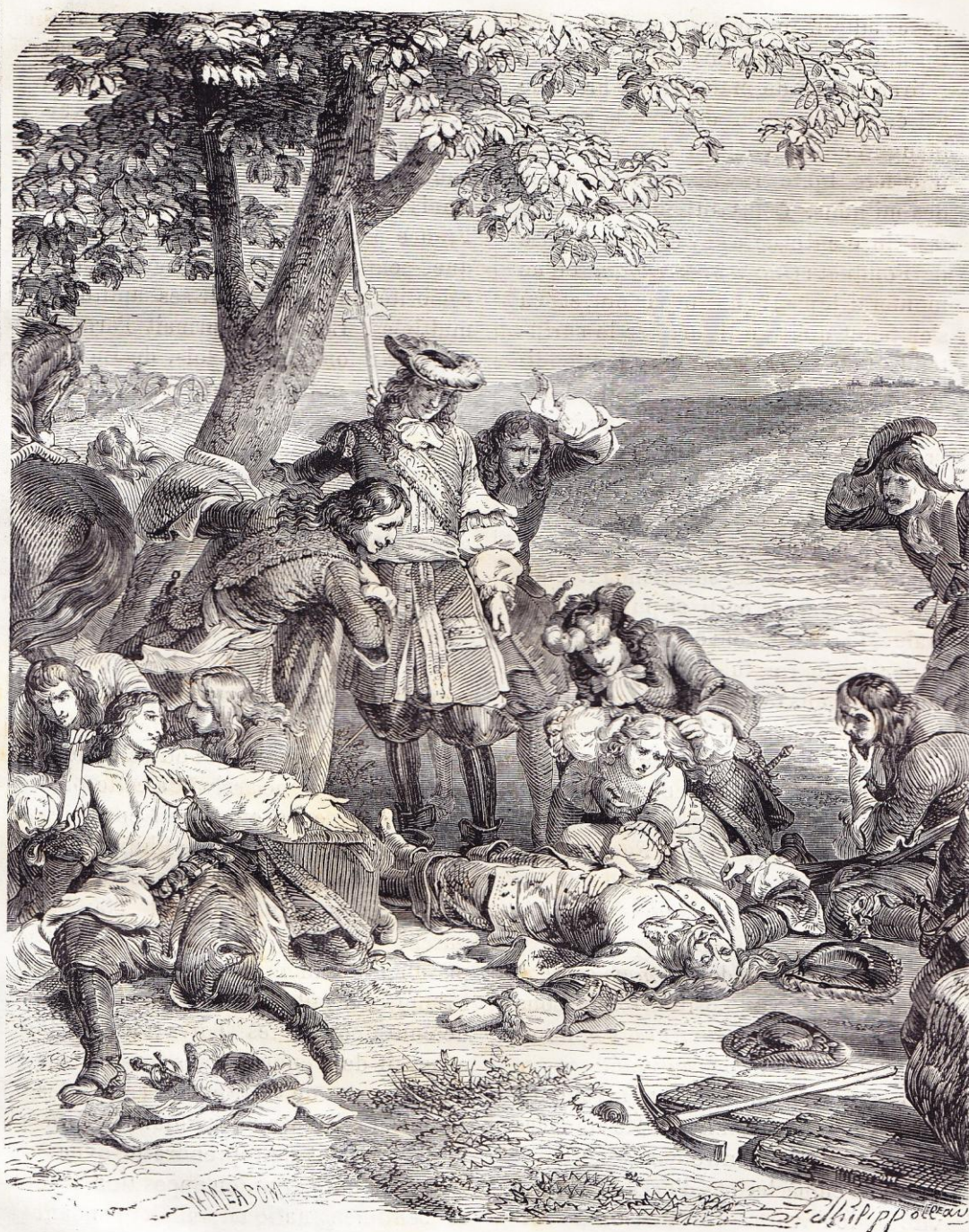
Mort de Turenne (27 juillet 1675).

par jour, lui démontrait, chiffres en mains, les rapines et les malversations du surintendant.